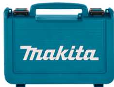
Koffer (1 stuks) - 158775-6 - 3240890276278